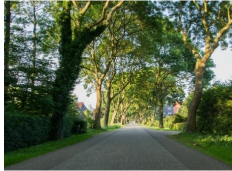
Inwoners vinden het openbaar groen in hun woonomgeving vaak belangrijk

Ook zijn er twee open vragen voorgelegd aan de inwoners: