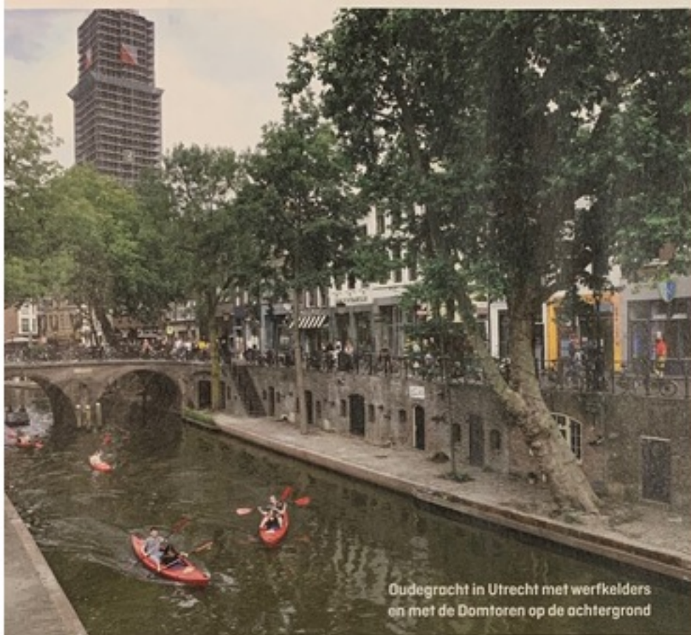
Oudegracht in Utrecht met werfkelders en met de Domtoren op de achtergrond

grote huizen in de natuur, veelal op 'arme', maar bosrijke zandgrond. Rozendaal scoort ten opzichte van Laren (plaats 2) en Heemstede (plaats 3) weliswaar zeer matig op het onderdeel winkelaanbod, maar compenseert dat ruimschoots met rust en ruimte.